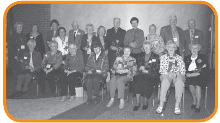
Quelques personnes ayant reçu une épinglette soulignant 25 années de service.