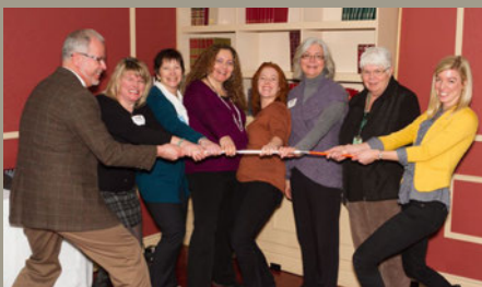
Le comité des coordonnateurs des bénévoles de la CSSCO